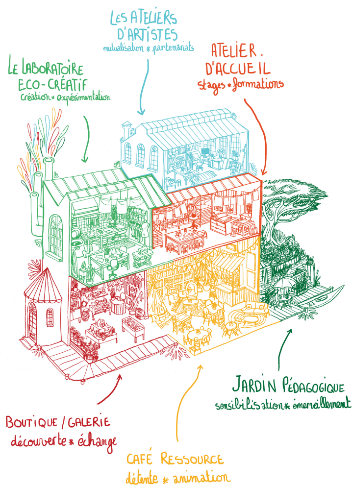
Figure 1 - Les différents espaces du lieu

- UN CAFÉ, ESPACE RESSOURCE : lieu d'échanges et de détente adapté à la saisonnalité. Un large choix de livres y est mis à disposition du public afin de compléter et mutualiser les connaissances en matière d'éco-créativité. Une offre de restauration indépendante (type foodtruck) y est proposée en complément de la buvette durant la haute saison.